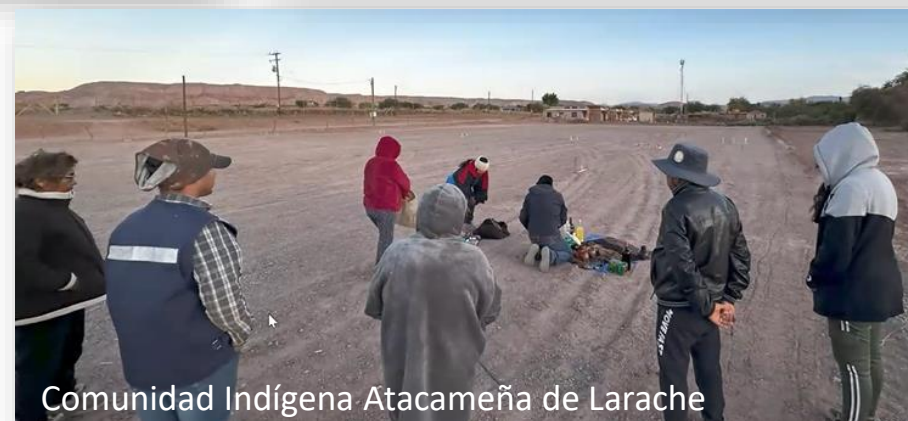
Comunidad Indígena Atacameña de Larache